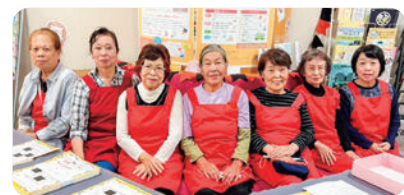
▲美濃加茂善意銀行