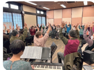
▲神中ふれあいサロン