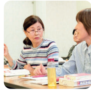
▲手話サークルやまびこ