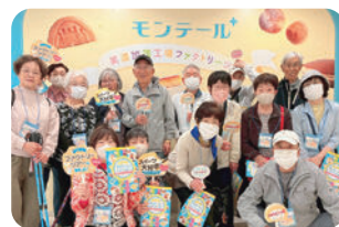
▲なんじゃもんじゃ中部台