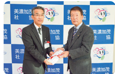
▲美濃加茂市健寿連合会