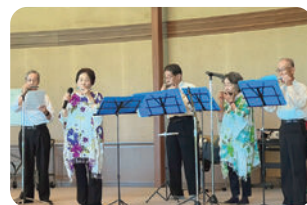
▲あじさいハーモニカ同好会