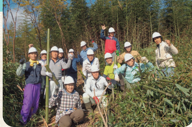
▲金谷里山整備支隊

令和7年11月14日(金)、社会福祉の発展に尽力または功績のあった方々に、表彰状や感謝状を贈呈しました。(順不同・敬称略)